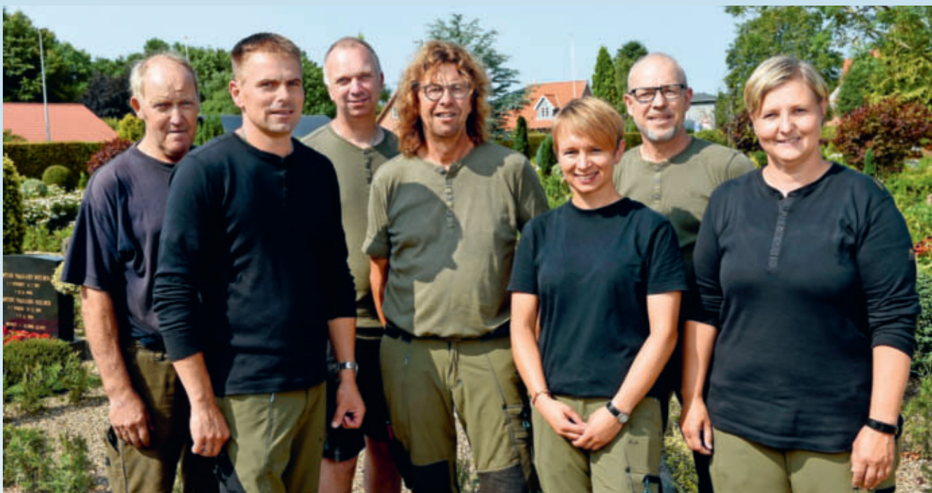
Medarbejderne i teamet på Tarm kirkegård inspirerer hinanden til at holde en høj standard på alle fire kirkegårde.