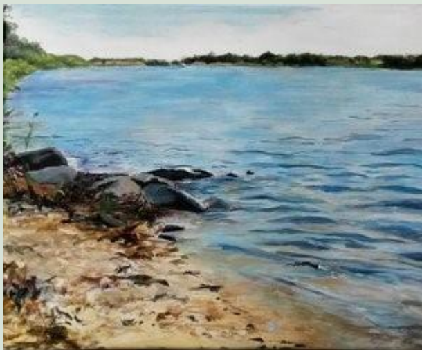
Laila Lykkevold udstillede forår 2017