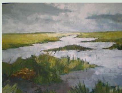
Grethe Dyrso Larsen udstillede efterår 2017