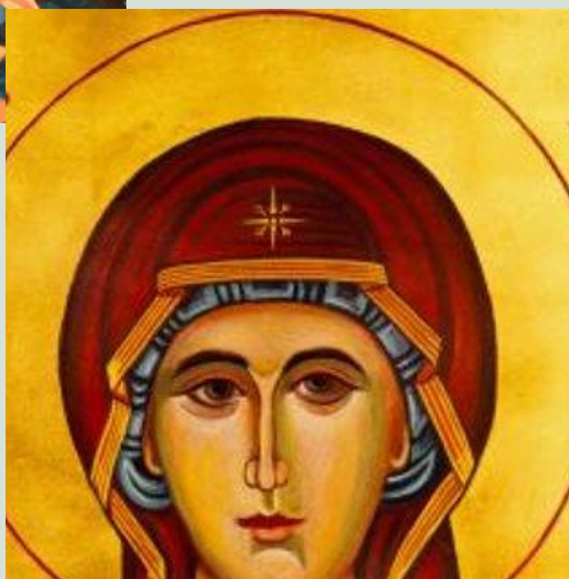
Aase Toft udstillede januar—marts 2016